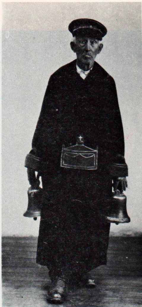
Este era el Barandales, allá por los años veinte.