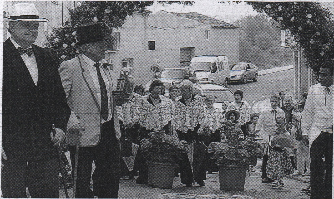
La comitiva pasa bajo el arco de flores que adornaba el acceso a la plaza de la iglesia.