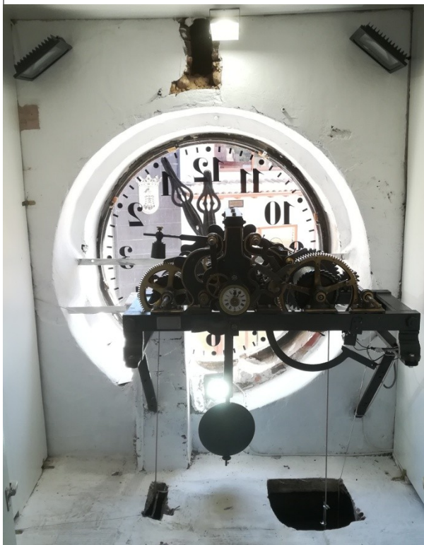
Rellotge restaurat amb nova il·luminació i caseta de protecció. (05-07-2020)