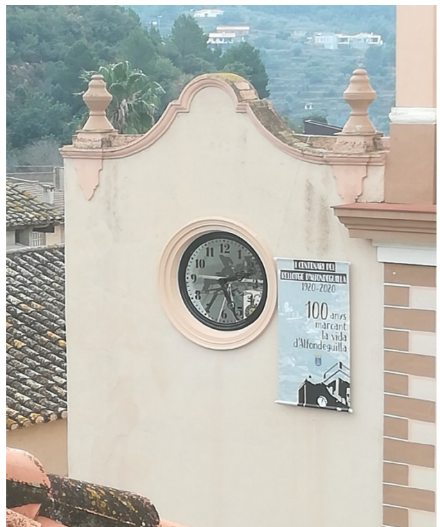
Nova esfera transparent i maquinària visible. (04-01-2020)