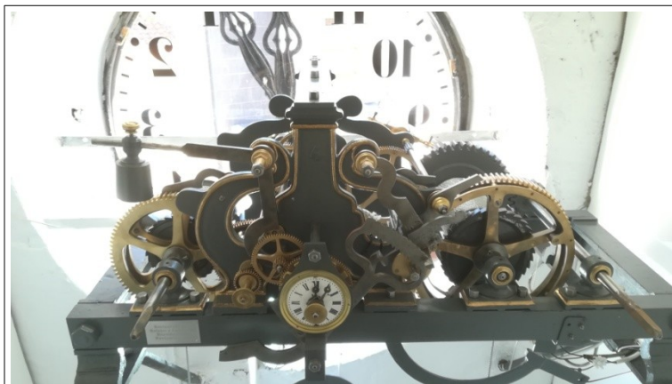
Mecanisme restaurat amb l'esfera visible. (05-07-2020)