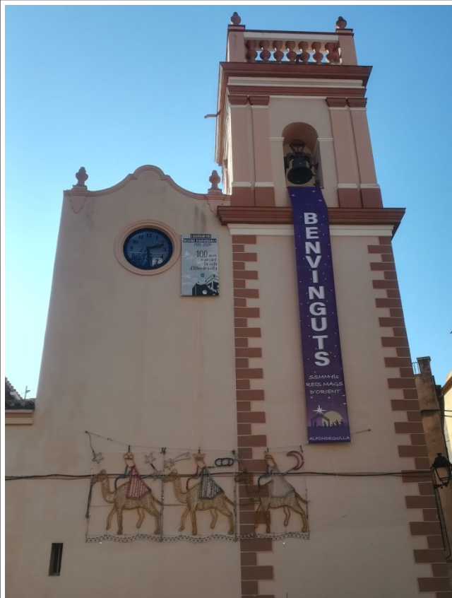
Campanar amb la nova esfera i cartell de la cavalcada de Reis i del centenar del rellotge. (04-01-2020)