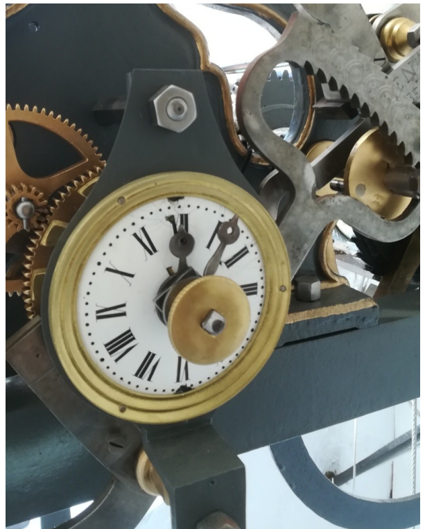
Mostra interior ((05-07-2020)