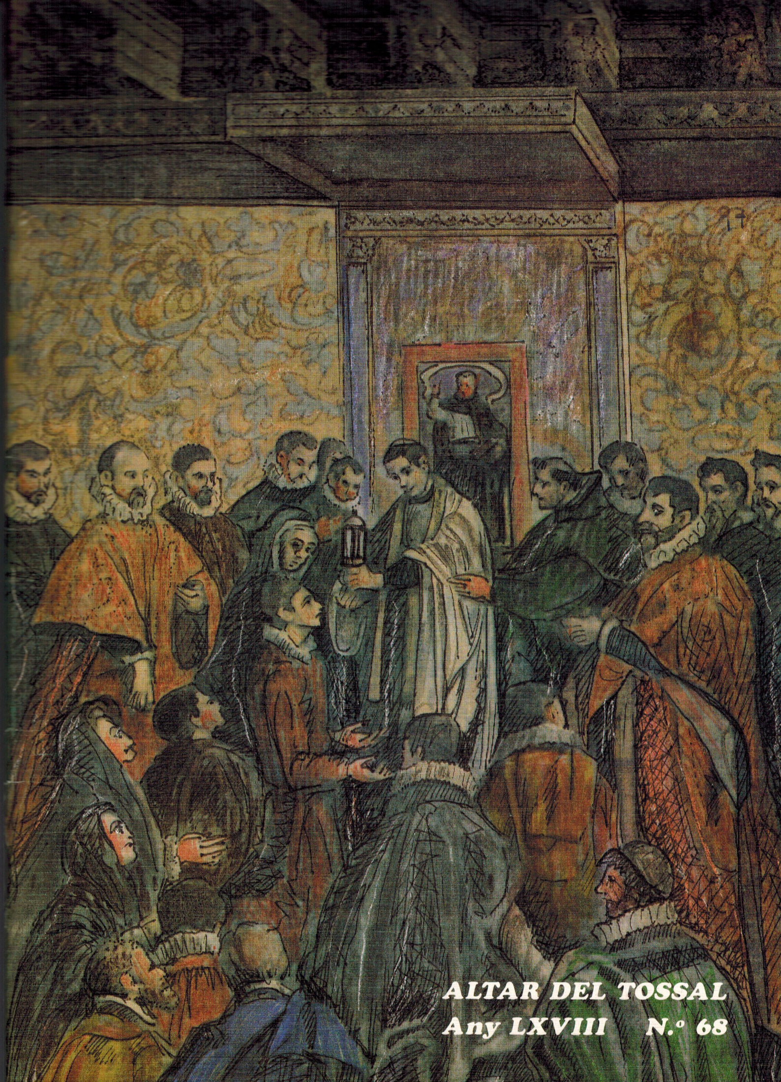
ALTAR DEL TOSSAL Any LXVIII N.º 68