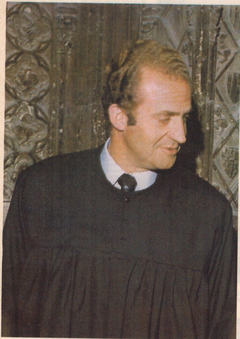
EL REY DE LOS FALLEROS. En el mundo fallero tenemos «falleros de honor», «falleras mayores», «presidentes de falla», y hasta un secretario y presidente de la Junta Central Fallera, máxima autoridad orgánica fallera. Sólo nos faltaba tener un rey. Un rey que se merezca ser nombrado «rey de los falleros». Este rey es, sin duda, Juan Carlos I, el Demócrata, que estos días falleros tiene prevista su visita a Valencia. Benvengut, rei!

REVISTA GALARDONADA CON EL «BUNYOL D'OR» Y EL «NINOT D'OR»